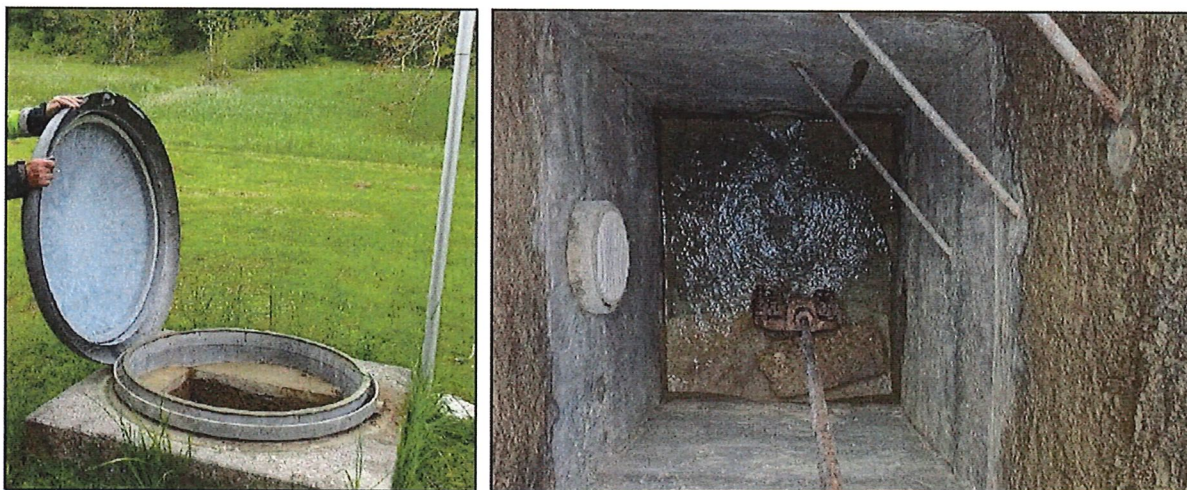
Figure 1 : Captage des îles ; chambre de rassemblement

En plus de la mise à niveau des chambres de captage, il a également été identifié dans le PDDE, la nécessité de redimensionner et de remplacer l'ancienne conduite de captage, qui relie les Îles à la STAP de Saint-Maurice.