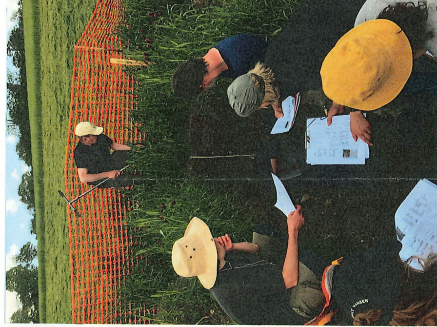
Étude d'un profil de sol