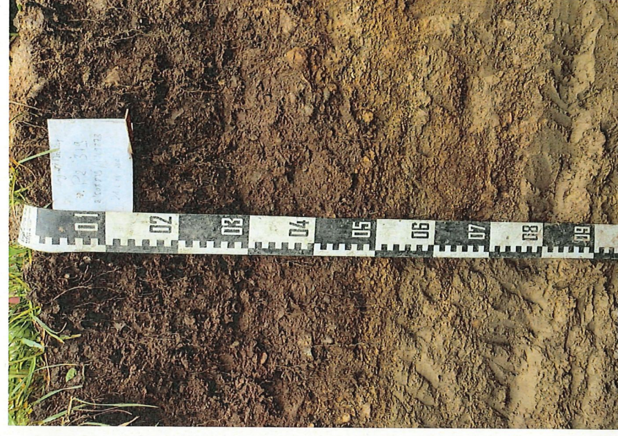
Profil d'un sol