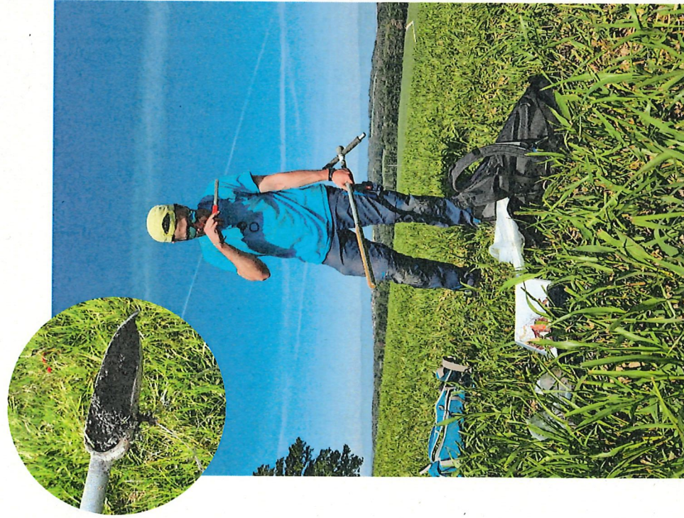
Investigation avec une tarière (sondage)

Le projet se déroulera jusqu'à fin 2025. Les pédologues (spécialistes des sols) réalisent des sondages à la tarière à la main, sans impacts sur les cultures. Une quarantaine de profils de sols seront creusés à l'aide d'une pelle mécanique, en tenant compte des cultures en place ou à venir. Les propriétaires et exploitants concernés seront informés.