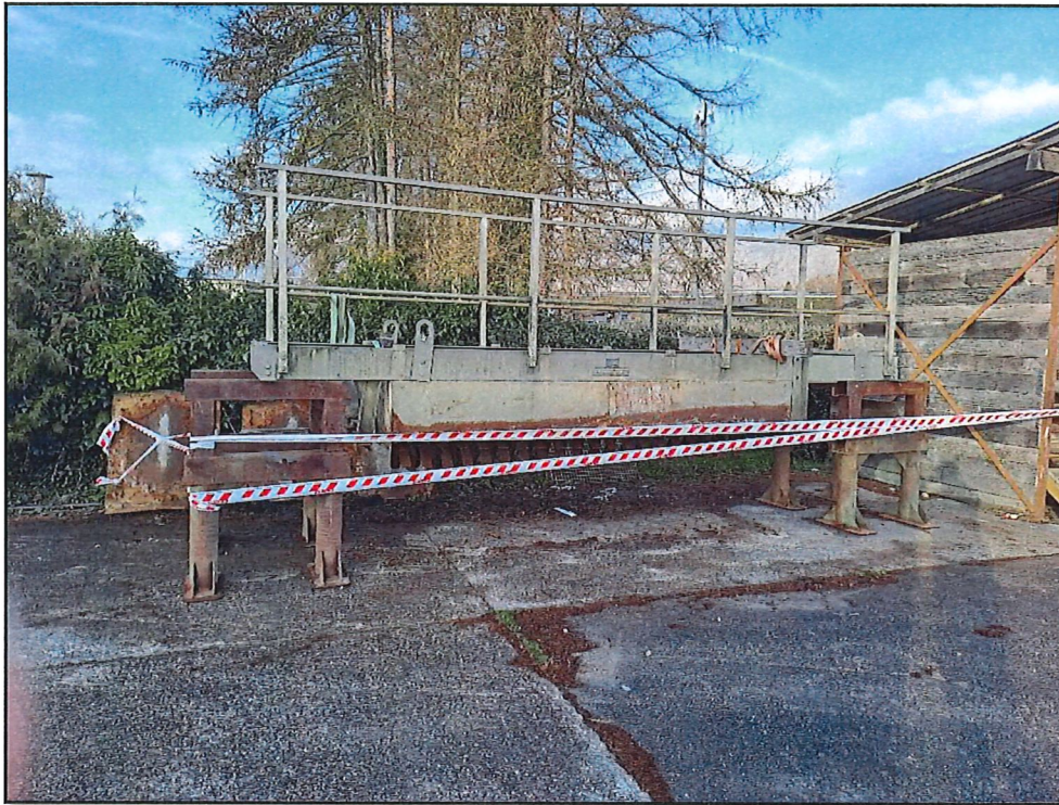
Pont supportant le brasseur