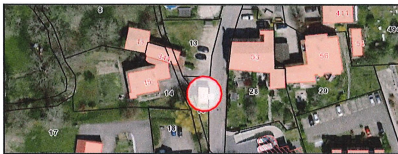
Situation de la STAP de Saint-Maurice

Le surplus d'électricité produit serait revendu à la Romande Energie.